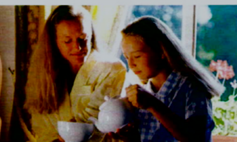
Pais e educadores devem vigiar as crianças, grupo bastante afectado por este problema